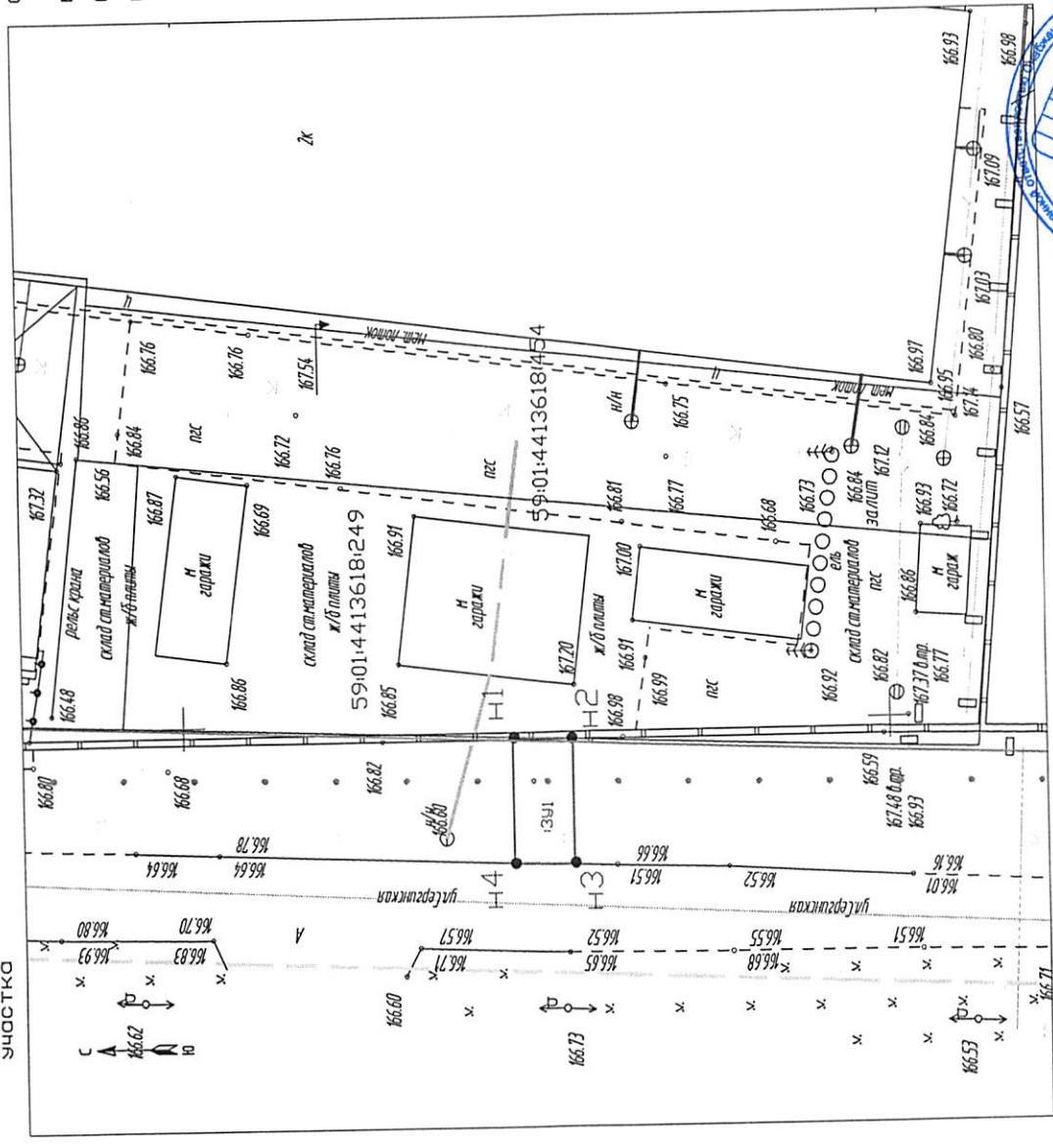
Схема предполагаемых к использованию земель или части земельного участка

Условные обозначения: Границы существующих земельных участков Проектируемая граница части земельного участка Номер кадастрового квартала Граница кадастрового квартала Красные линии